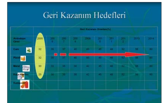
Geri Kazanım Hedefleri tablosu, T.C. Çevre ve Orman Bakanlığı