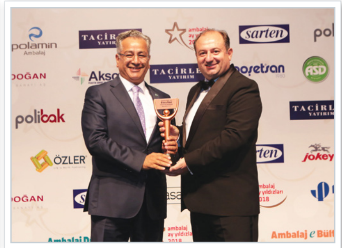
Ödül alanlar Winners