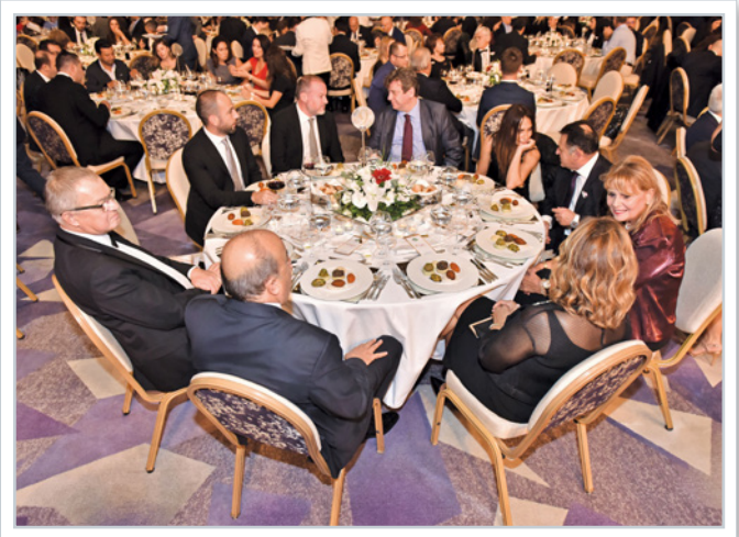
Gala yemeğinden kesitler Views from ceremony dinner