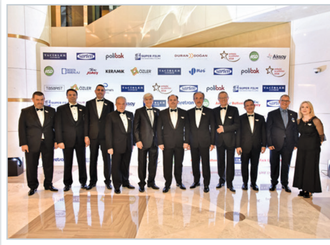
ASD Yönetim Kurulu ASD Board of Directors