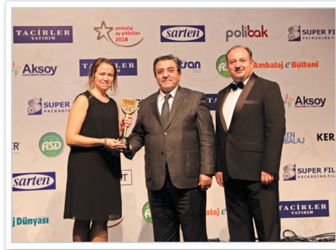
TSE & ASD İşbirliğinde Altın Ambalaj Ödülü Alanlar Winners of Gold Packaging Awards given by TSE & ASD