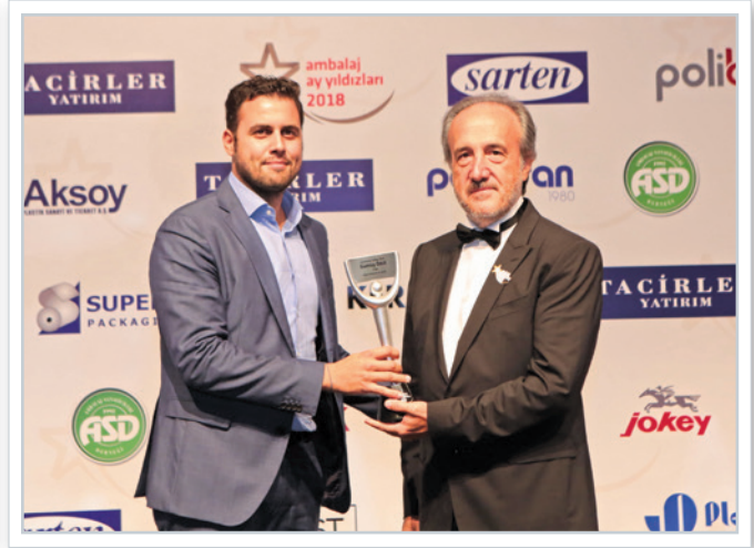
Ödül alanlar Winners