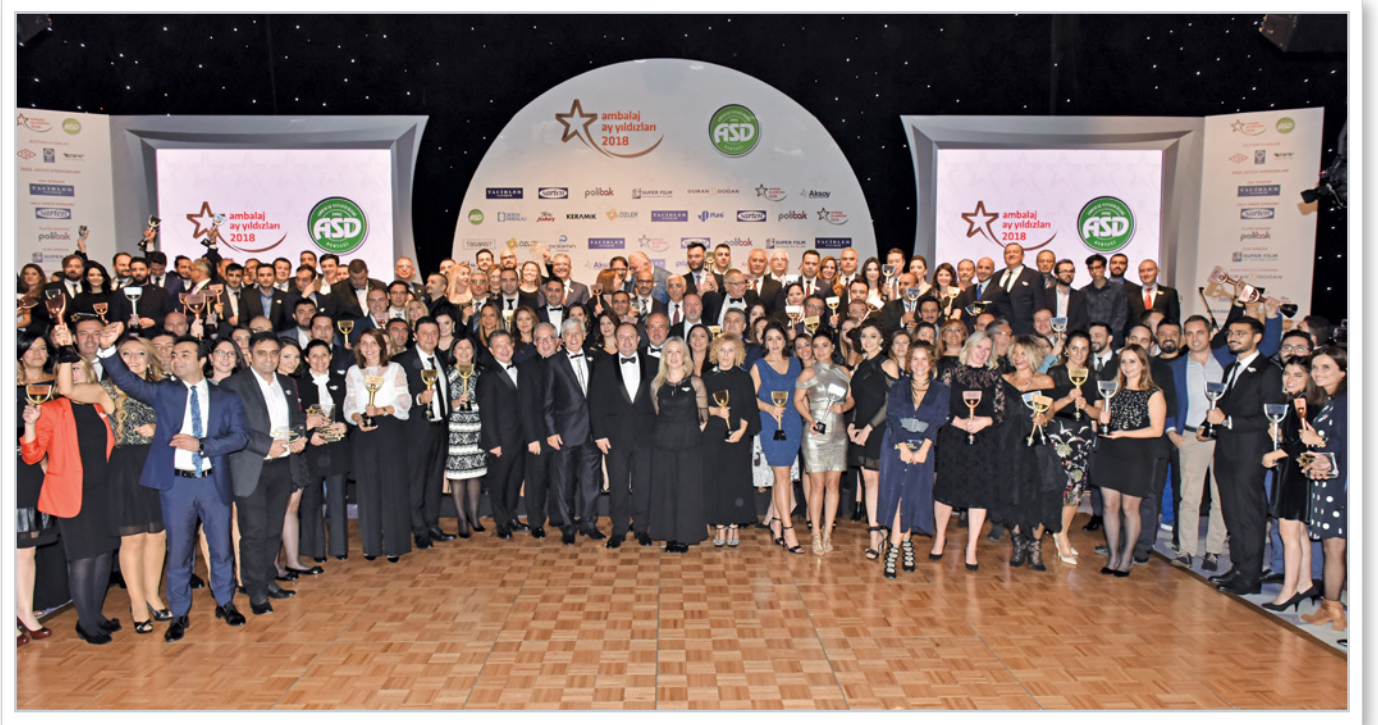
Ödül sahipleri bir arada Winners of the Crescent and Stars for Packaging 2018