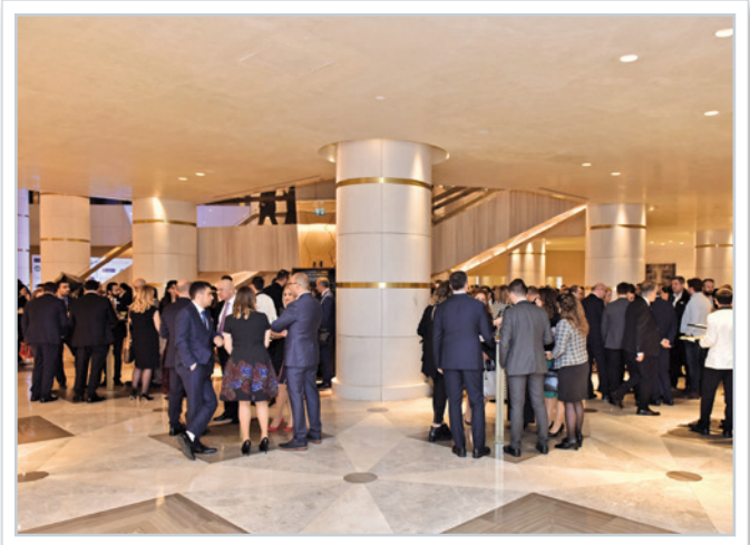
Ödül töreni kokteyli Awards ceremony reception