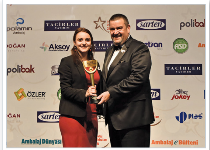
Ödül alanlar Winners