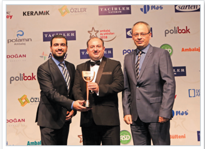
Ödül alanlar Winners