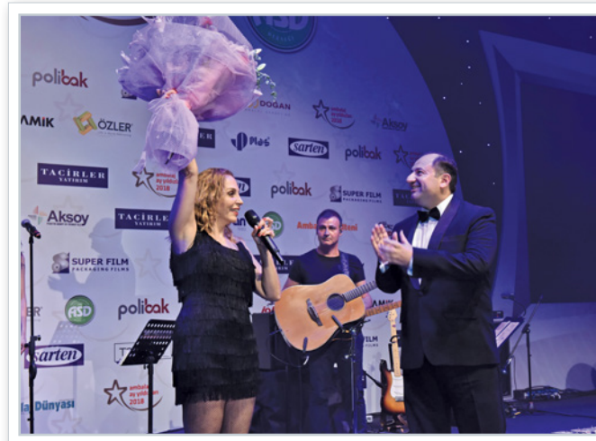
Sertab Erener konserinden kesitler Views from concert of the Sertab Erener