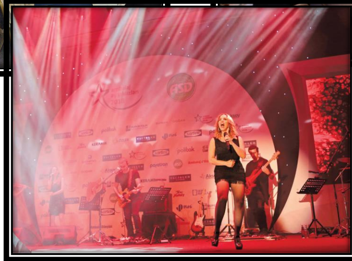
Sertab Erener Konseri